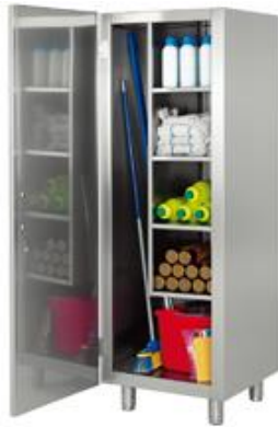
Preparación estática - Armarios - Armarios para artículos de limpieza