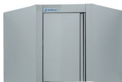
Armario de pared de esquina