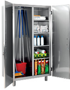
Armarios para artículos de limpieza