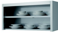
Armarios de pared abiertos