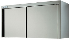
Armarios de pared