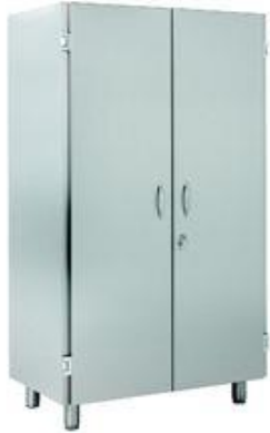
Preparación estática - Armarios - Armarios altos de pie