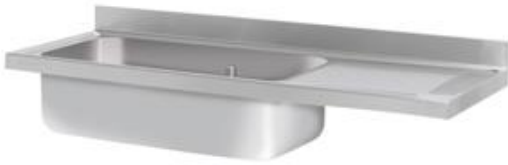
Preparación estática - Fregaderos industriales - Fregaderos industriales - Gama Gran Capacidad