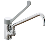
Grifería industrial Grifos monomando