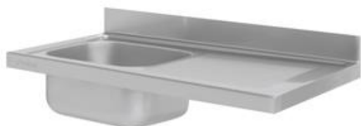
Preparación estática - Fregaderos industriales - Fregaderos industriales - Gama 600