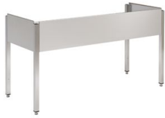
Bastidores para fregaderos de gamas 600 y 700