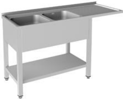
Preparación estática - Fregaderos industriales - Fregaderos industriales - Soldados a bastidor Gama 500 y 550 - Gama Lavavajillas