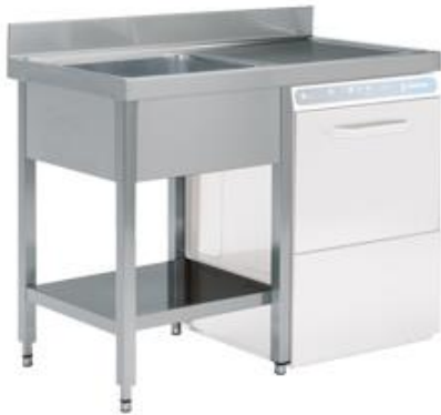
Preparación estática - Fregaderos industriales - Fregaderos industriales - Soldados a bastidor gama 600 y 700 - Gama lavavajillas