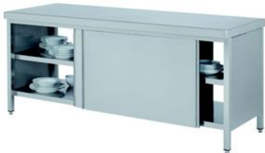
Preparación estática - Mesas de trabajo - Mesas de trabajo murales y centrales - centrales con puertas