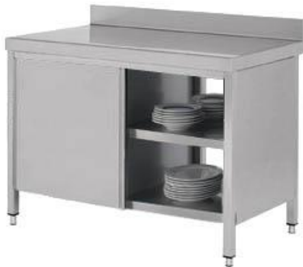
Preparación estática - Mesas de trabajo - Mesas de trabajo murales y centrales - Murales con puertas